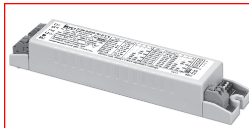
ATON 30/250-700 BI

1-2kV DIFF. 2kV COMM. ACTIVE PFC DIP-SWITCH SEC. SWITCH SAFETY PROTECTIONS